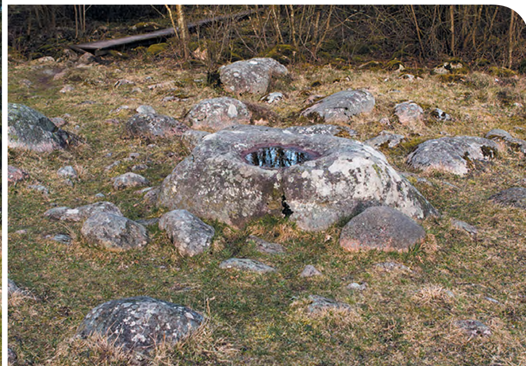
3-4 | Rezerwat Głazowisko Łopuchowskie (obok) oraz (u góry) rezerwat Głazowisko Bachanowo nad Czarną Hańczą

rzeka Szeszupa. W obrębie granic SPK znajduje się aż 26 jezior, przeważnie pochodzenia wytopiskowego. Dwa główne ciekі to Czarna Hańcza i Szeszupa, spływające do Niemna. Polodowcową pamiątką są okazałe głazy przetransportowane tu z lądolodem aż z gór skandynawskich i dna Morza Bałtyckiego, które tworzą rozległe głazowiska . Najciekawsze głazowiska znajdują się w obrębie trzech rezerwatów – w Bachanowie nad Czarną Hańczą, w Łopuchowie (rezerwat Głazowisko Łopuchowskie) i Rutce (rezerwat Rutka). Dodatkowo ochroną rezerwatową objęte jest jezioro Hańcza.