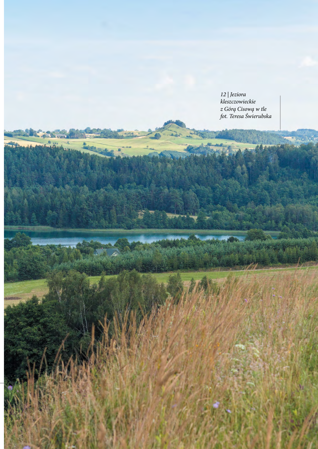
12 | Jeziora kleszczowieckie z Górą Cisową w tle