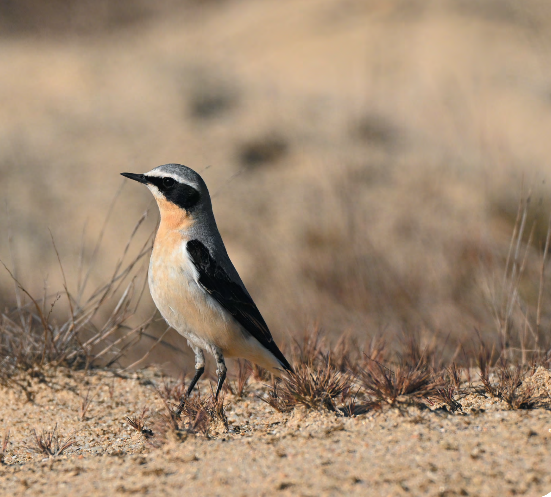
17 | Samiec białorzutki Oenanthe oenanthe (kopalnia „Pieńsk”, 15.04.2026 r.)