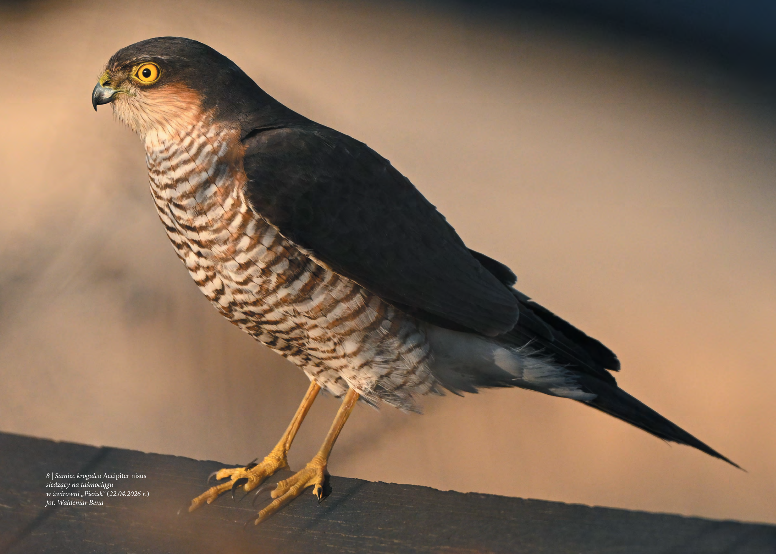
8 | Samiec krogulca Accipiter nisus siedzący na taśmociągu w żwirowni „Pieńsk” (22.04.2026 r.)