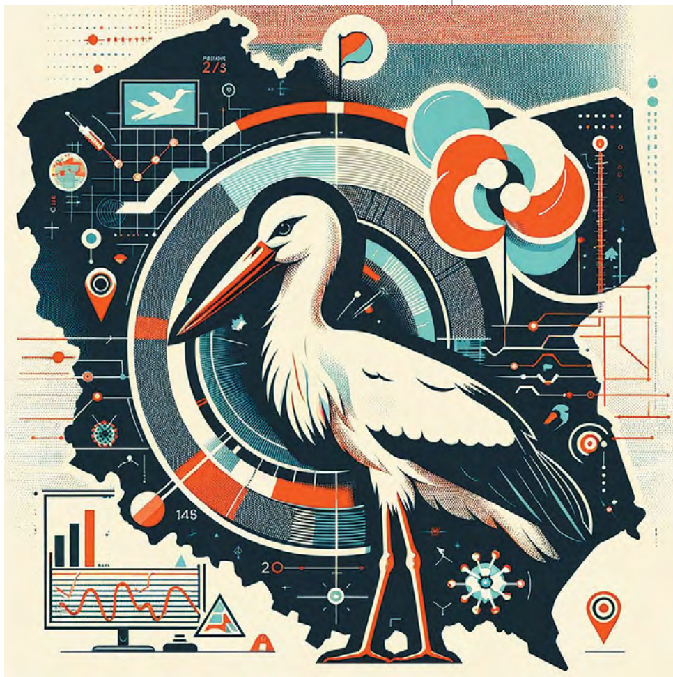
1 | Grafika podsumowująca argumenty przywoływane w tekście, przygotowana z wykorzystaniem AI – ChatGPT 4