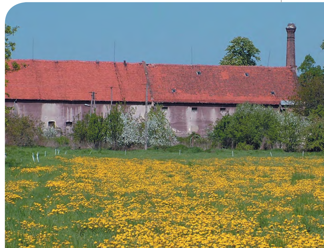
5 | Głównym żerowiskiem bociana białego w Polsce są łąki i pastwiska, nawet silnie nawożone, czego przejawem może być dominacja mniszka lekarskiego (Przystronie, woj. dolnośląskie, 11.05.2006 r.;)