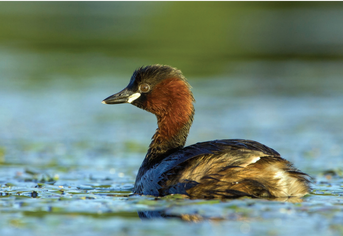
Ryc. 5. Perkozek Tachybaptus ruficollis (Spytkowice, 3.07.2007 r.;)

Fig. 5. Little Grebe Tachybaptus ruficollis (fish farm in Spytkowice, 3 July, 2007;)