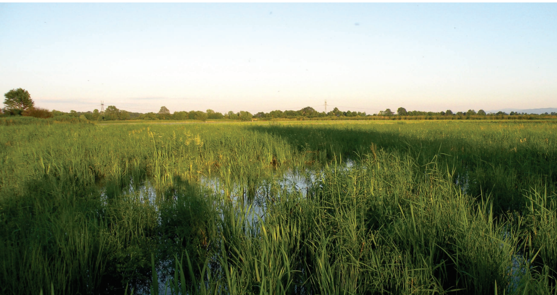
Ryc. 7. Odradzająca się roślinność wynurzona klasy Phragmition – szuwały właściwe (Stawy Monowskie, 16.06.2012 r.;)

Fig. 7. Resurgent vegetation uncovered of Phragmition class (Stawy Monowskie fish farm, 16 June, 2011;)