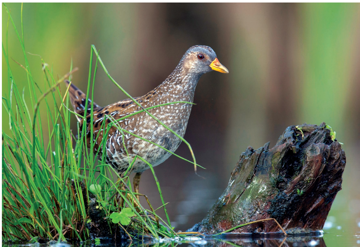
Ryc. 2. Kropiatka Porzana porzana (Rudze, 18.09.2012 r.;)

Kontrole prowadzono pod kątem wykrycia rewirów wodnika (ryc. 1), kropiatki (ryc. 2) i zielonki (ryc. 3). Odnotowywano także rozmieszczenie i liczebność współwystępującej kokoszki (ryc. 4) oraz perkozka (ryc. 5). Mapowanie wszystkich gatunków wykonano w latach 2013 i 2014, w dniach: 18–19.04, 22–23.04, 22–28.05.2013 r. oraz 18–19.04, 21–24.04 i 3–8.05.2014 r., w godzinach późnopopołudniowych i wczesnonocnych (do godz. 21:30), za pomocą stymulacji głosowej prowadzonej w lokalizacjach o największym prawdopodobieństwie usłyszenia głosu zwrotnego. Efektywność pierwszej kontroli w roku 2013 była niska z racji wyjątkowo późnej wiosny, stąd konieczność opóźnienia drugiej tury liczeń.