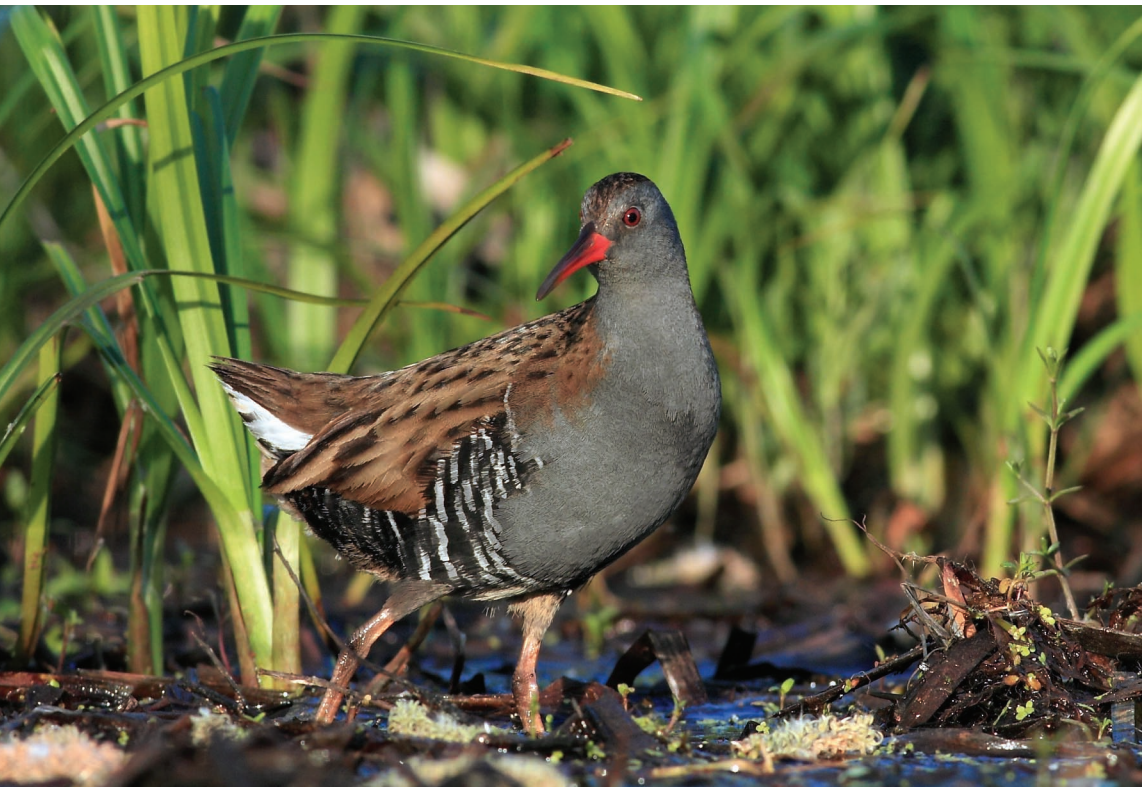
Ryc. 1. Wodnik Rallus aquaticus (Spytkowice, 13.05.2011 r.;)