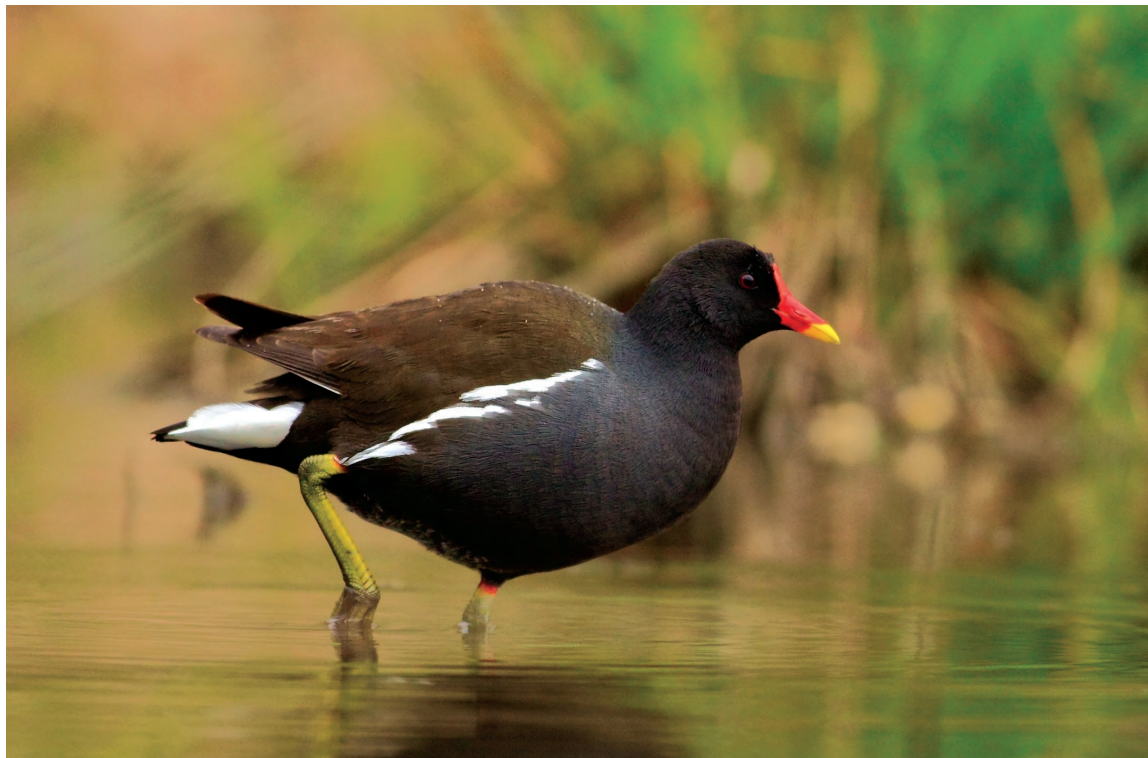
Ryc. 4. Kokoszka Gallinula chloropus (Spytkowice, 7.04.2011 r.;)

Fig. 4. Moorhen Gallinula chloropus (Spytkowice fish farm; 7 April, 2011; photo by P. Sobas)