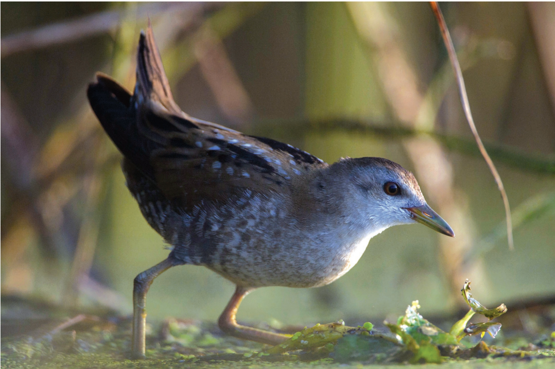
Ryc. 3. Zielonka Porzana parva (Przeręb, 28.08.2008 r.;)

Fig. 3. Little Crane Porzana parva (Przeręb fish farm, 28 August, 2008; photo by R. Gawęda)